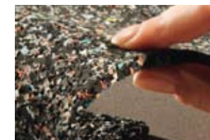
Nur 6 mm stark – die Drainbase-Schallschutzmatte