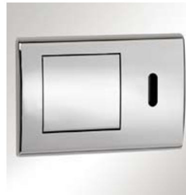
WC-Elektronik TECEplanus mit IR-Sensor. Lieferbar als Batterie- oder Netzvariante. Betätigungsplatte in Edelstahl oder Chrom