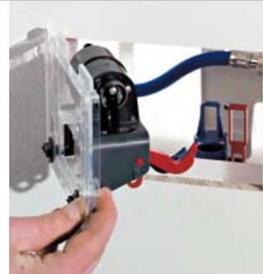
Einbau des Servomotors in den Spülkasten

Bei der Infrarot-Auslösung sorgt ein Autofokus-Infrarotsensor für die sichere Erkennung von sitzenden oder stehenden Personen. Die Infrarot-Elektroniken werden inklusive Betätigungsplatte in Chrom glänzend oder Edelstahl gebürstet angeboten. Neben der automatischen Spülauslösung steht hierbei immer auch die mechanische Auslösung zur Verfügung.